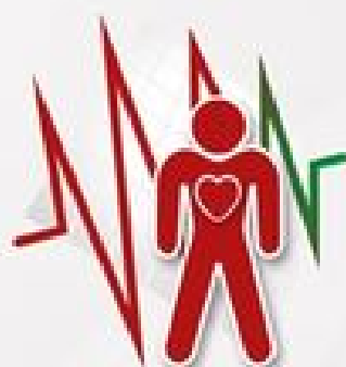
PRZYSPIESZONA CZYNNOŚĆ SERCA