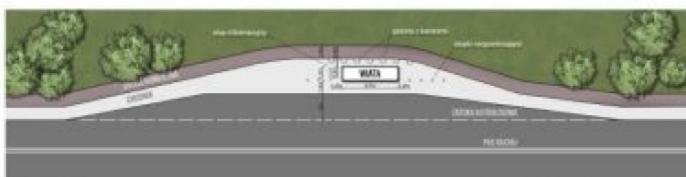
PLAN ZAGOSPODAROWANIA TERENU, SKALA 1:200