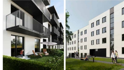
Zespół budynków mieszkalnych