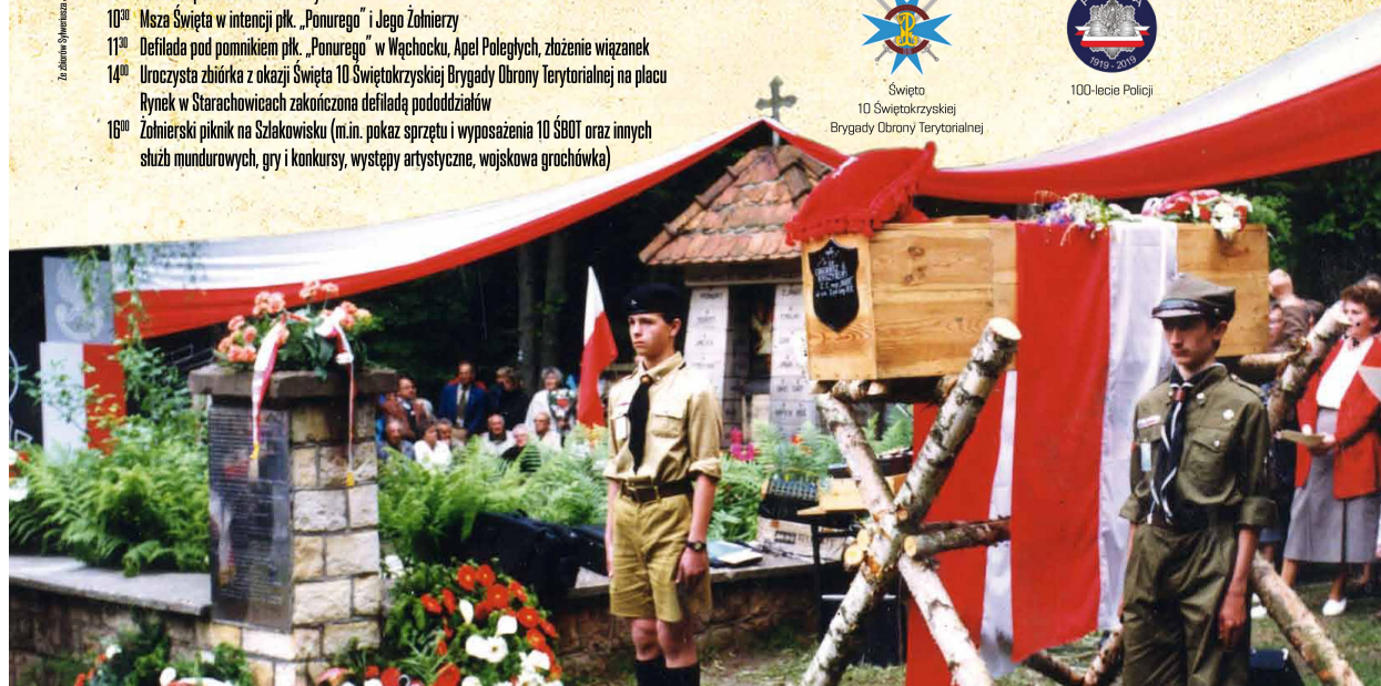
Wspieracie organizacyjnie i finansowo w organizacji uroczystości