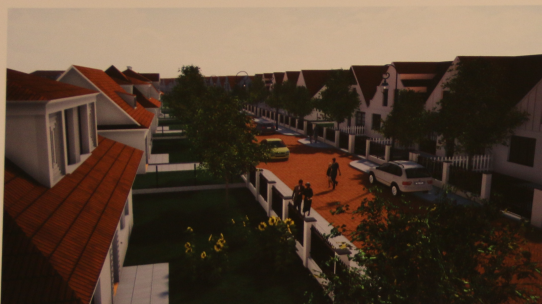
Fragment projektowanej ulicy na południowo-zachodniej części obszaru opracowania