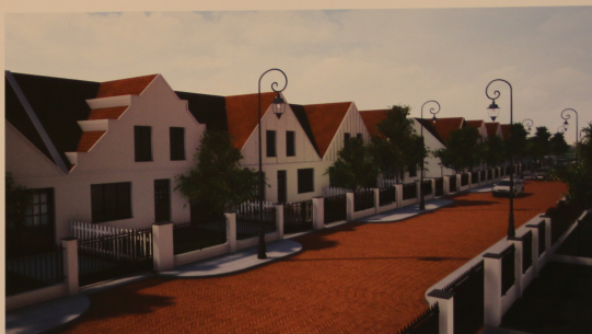
Projektowana zabudowa szeregowa