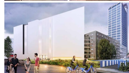
Qubus hotel Kalinowa, ul. Montażu Qubus Hotel Management Sp. z o.o.

Powierzchnia netto Izba projektu Rok projektu