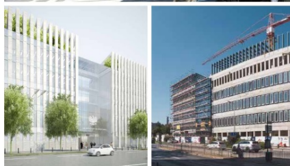
Sąd Apelacyjny we Wrocławiu Wrocław, ul. Piłsudskiego Sądzi-Parłowa - Sąd Apelacyjny we Wrocławiu