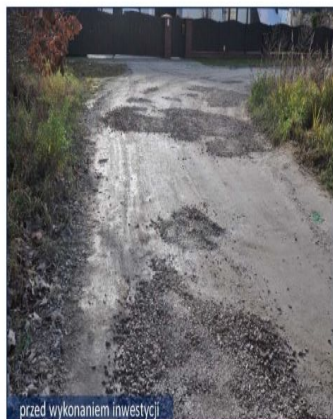
przed wykonaniem inwestycji

jezdnię asfaltową - koszt: 533 010,26 zł, kanalizację deszczową - koszt: 83 425,11 zł