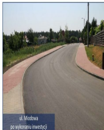
ul. Miodowa po wykonaniu inwestycji