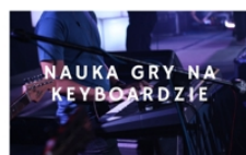
PROWADZI PIOTR MRÓZEK