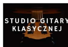
PROWADZI WALDEMAR DZIURA