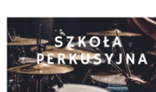
PROWADZI GRZEGORZ DZIAMKA